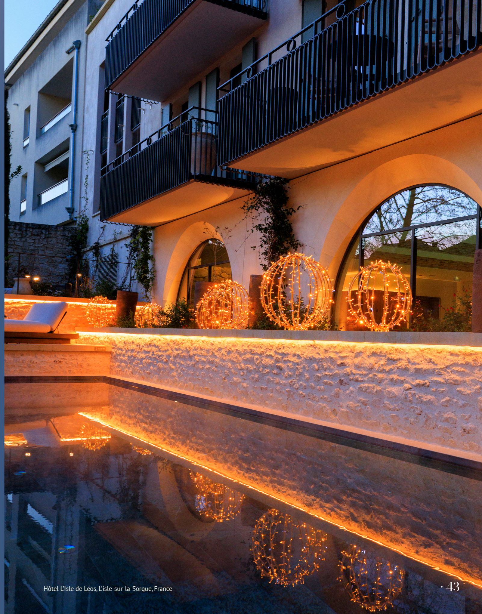
Hôtel L'Isle de Leos, L'isle-sur-la-Sorgue, France