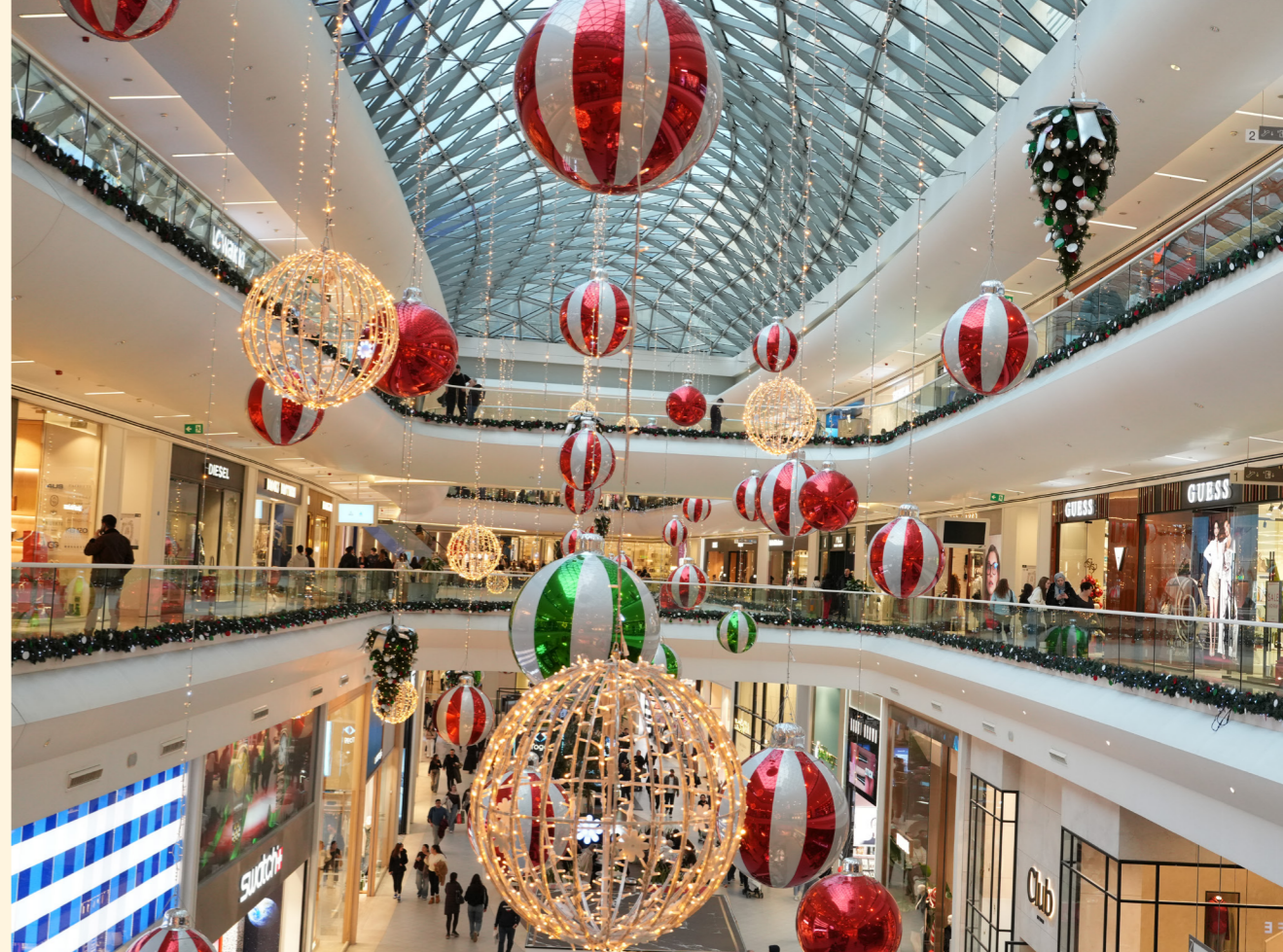
Akasya Mall, Istanbul, Turkey