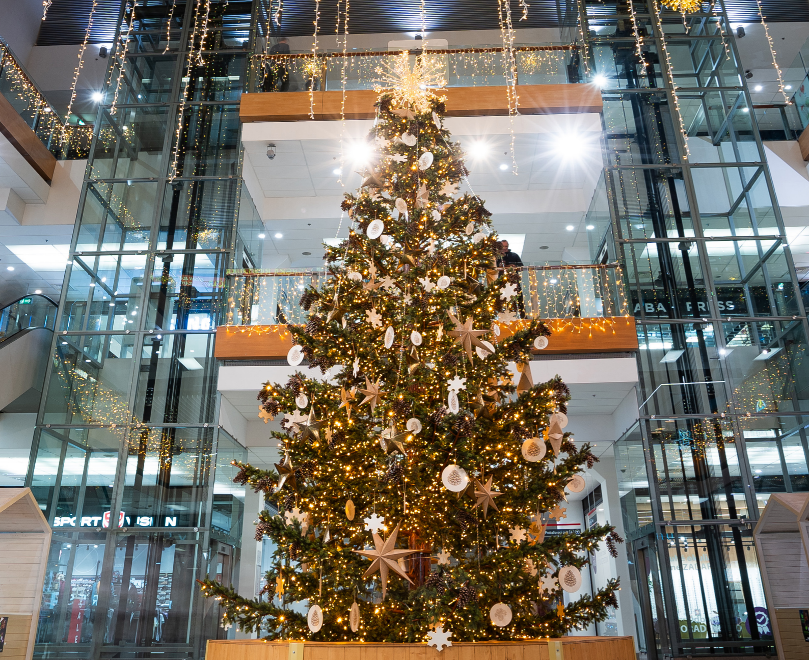
Banská Bystrica, Slovakia