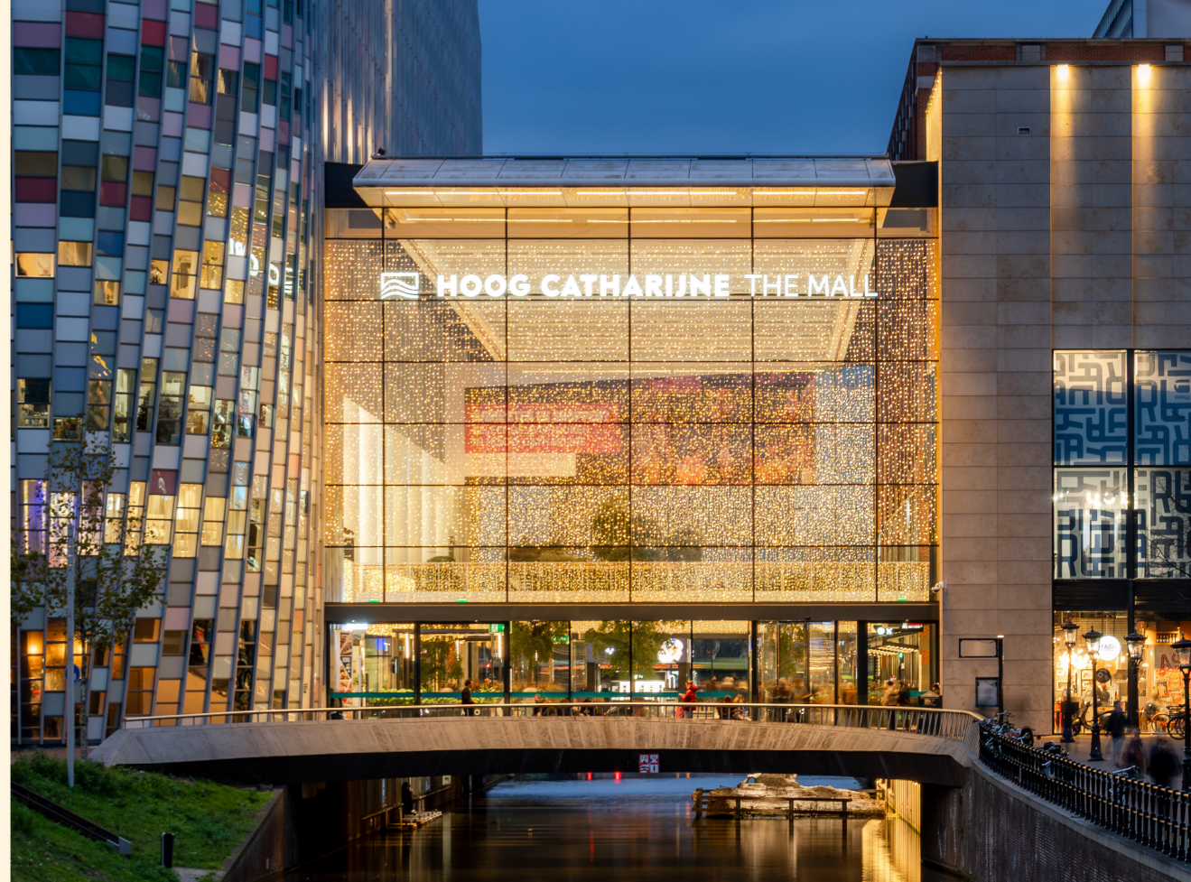
Hoog Catharijne, Utrecht, The Netherlands