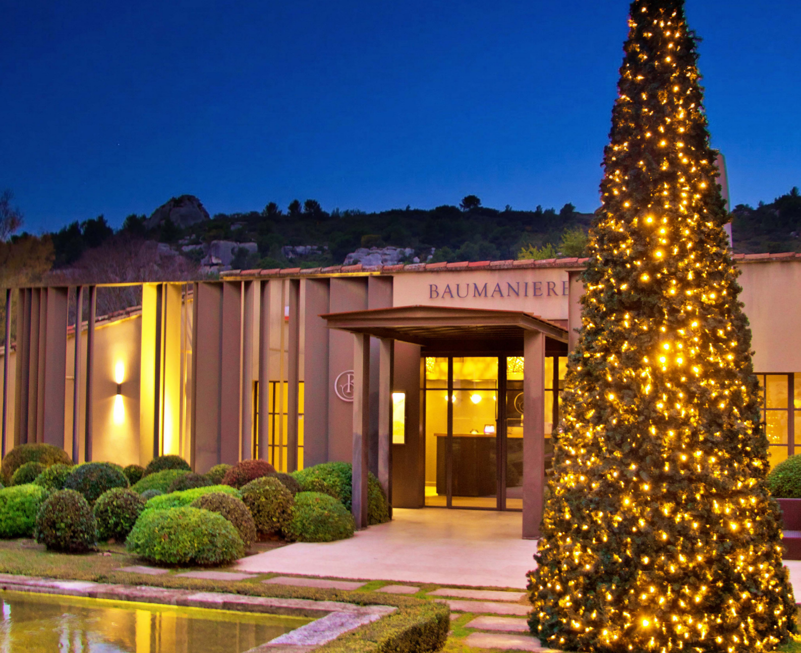
Baumanière Hôtel, Les Baux-de-Provence, France