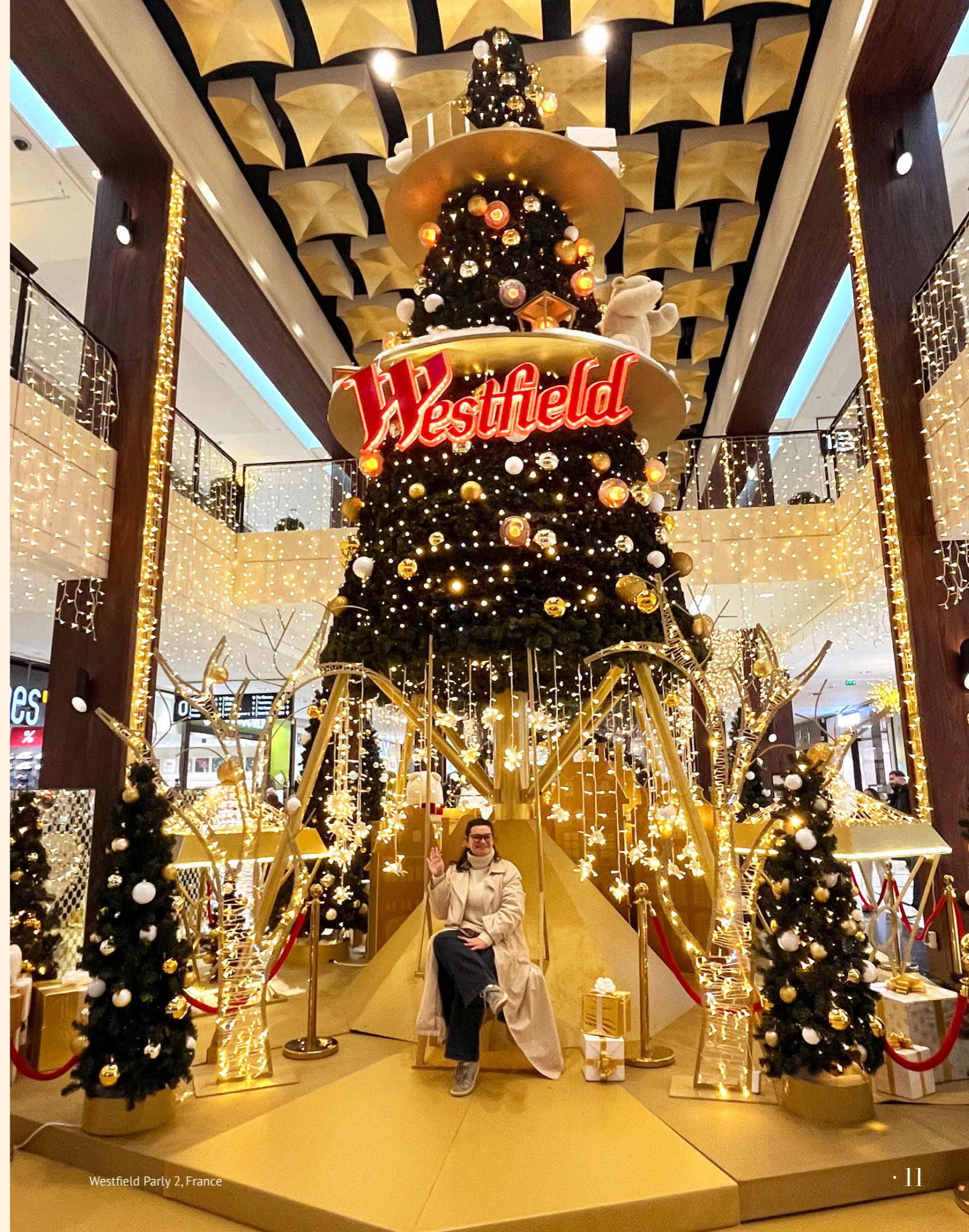
Westfield Parly 2, France