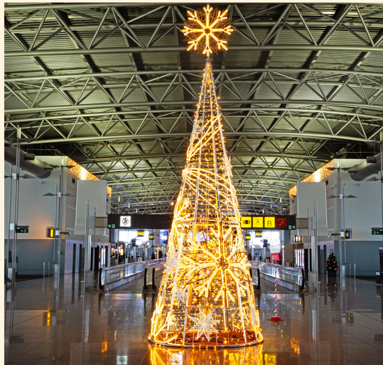
Brussels Airport, Zaventem, Belgium