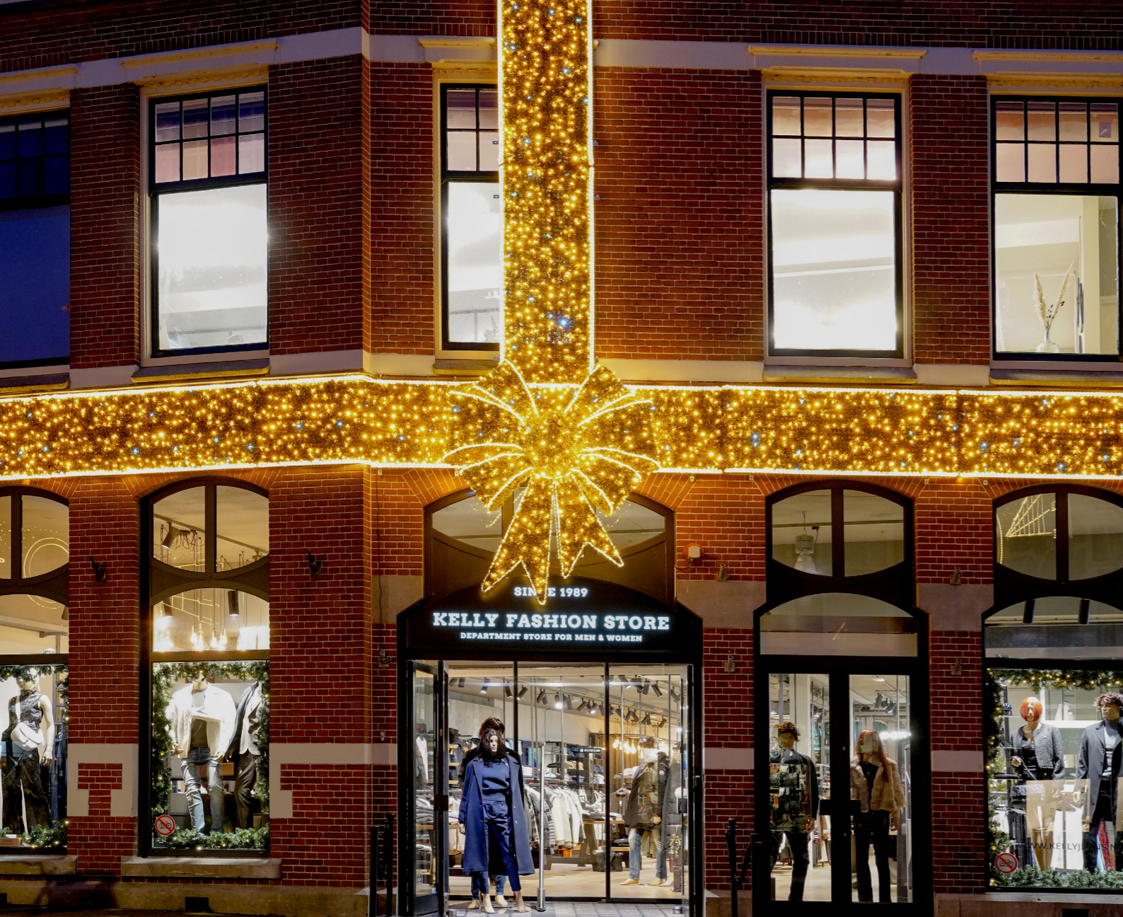
Kelly Fashion, Hoorn, The Netherlands