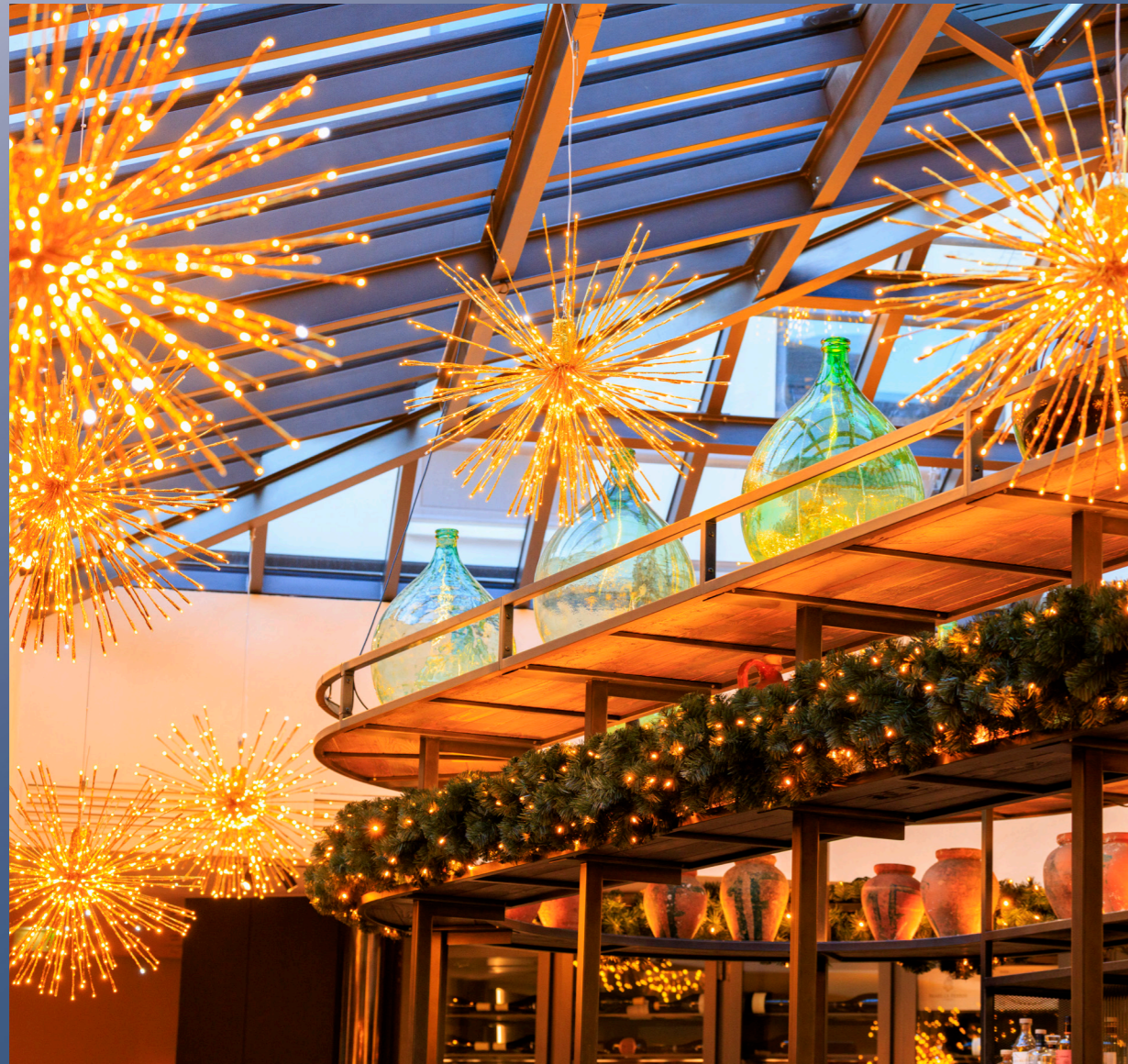
Hôtel L'Isle de Leos, L'isle-sur-la-Sorgue, France