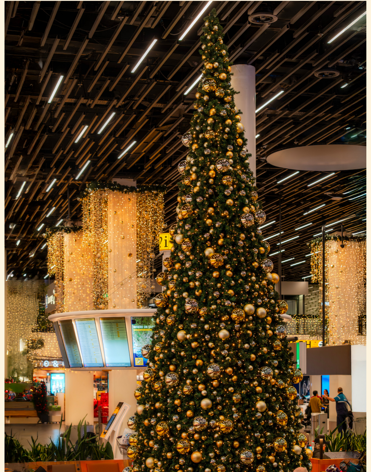
Schiphol Amsterdam Airport, The Netherlands

For the festive season, train stations and terminals light up, turning each journey into a magical moment.