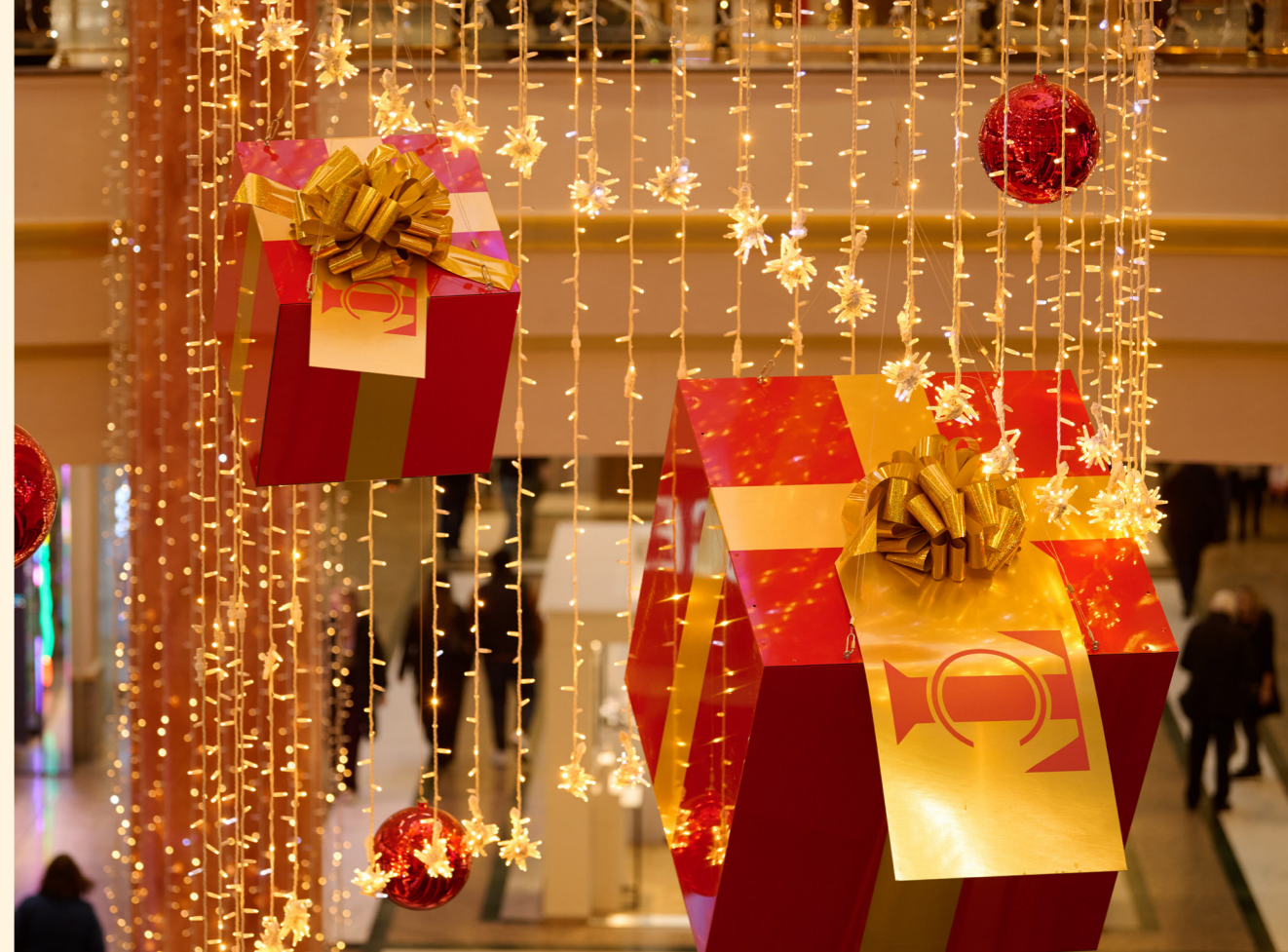
Trafford Centre, Manchester, UK