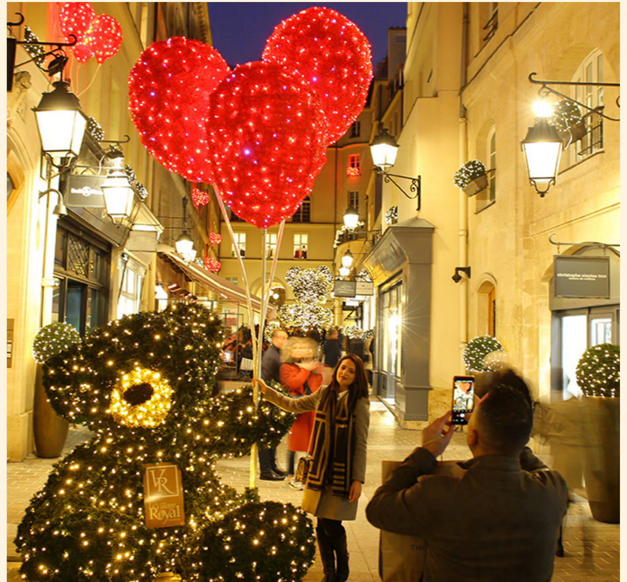
Village Royal, Paris, France

Hidden corners, luminous passages, and magical wanderings.