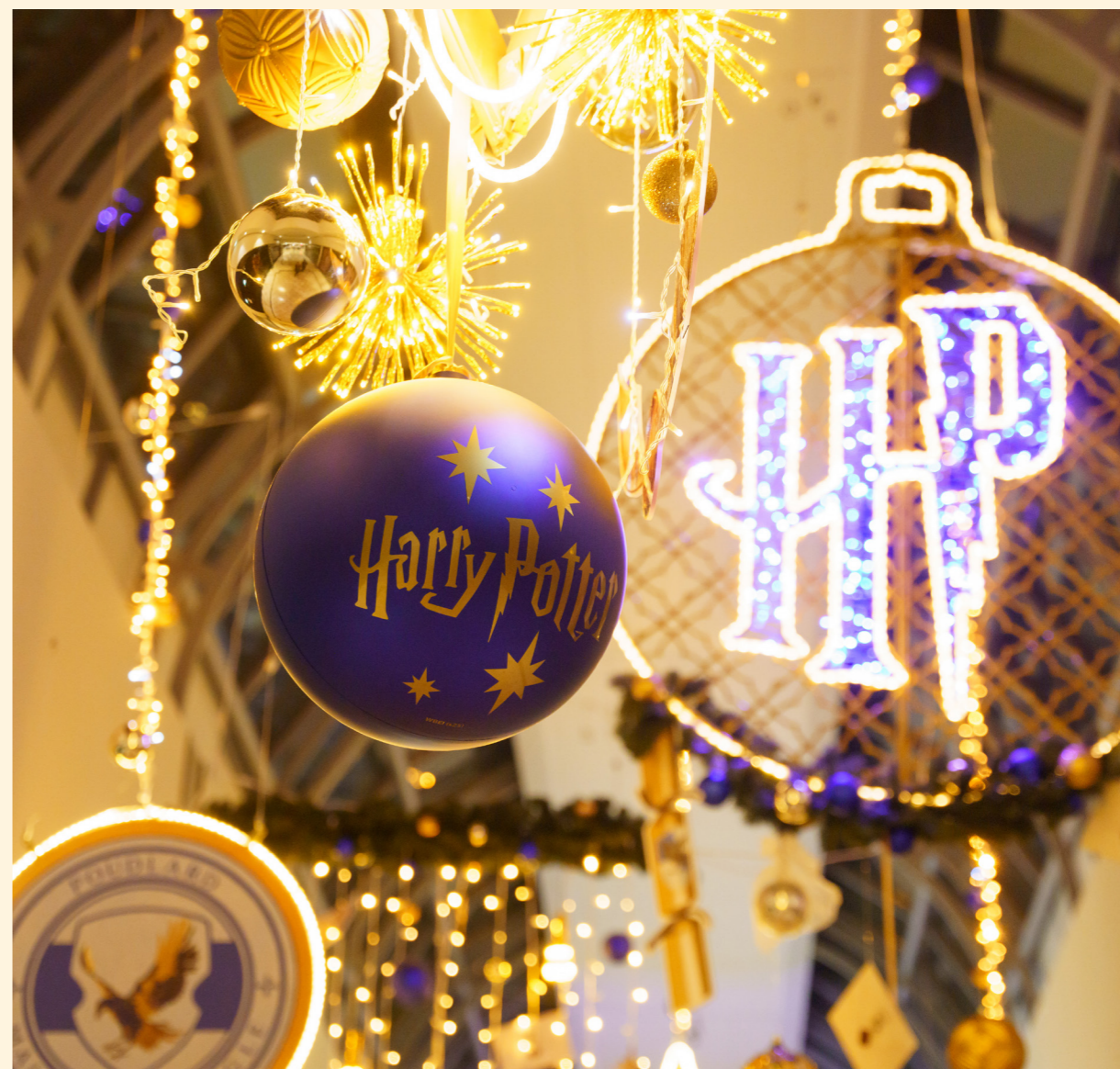
Klépierre Val d'Europe, France