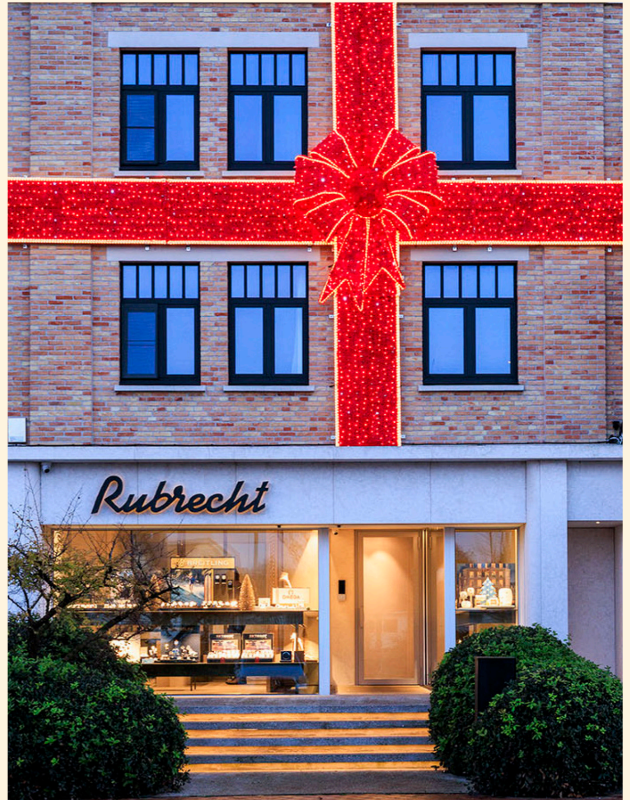
Rubrecht, De Haan, Belgium

As the festive season approaches, shop windows sparkle with magic and elegance.