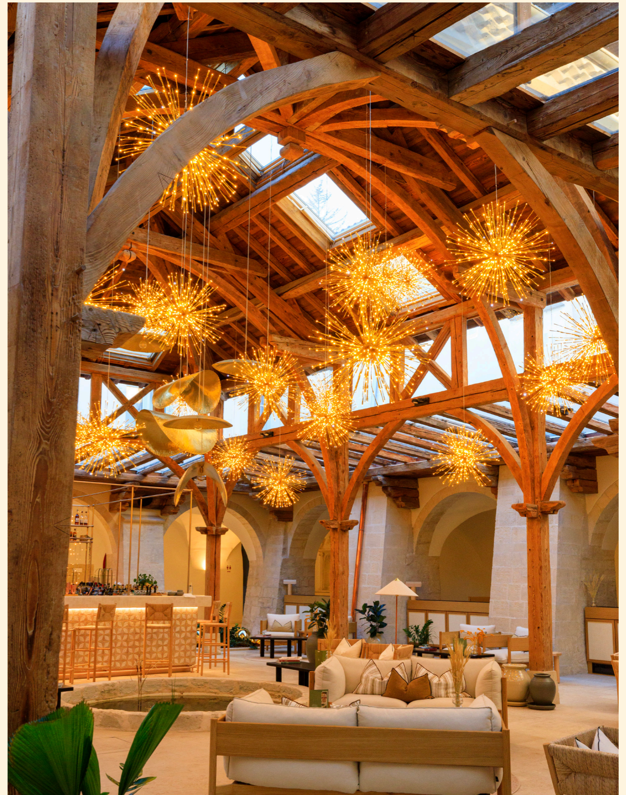
Hôtel & Spa L'Occitane en Provence, Couvent des Minimes, Mane, France

Under a dazzling light display, hotels and casinos set the scene for an unforgettable night.