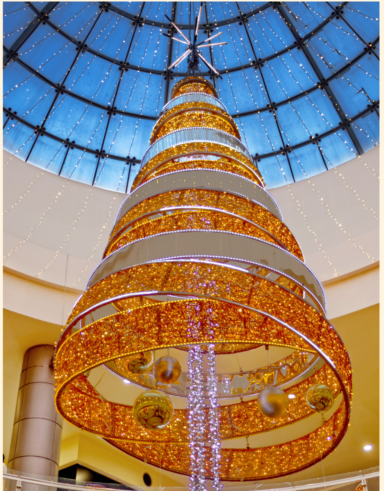
Centro comercial Cibeles Irapuato, Guanajuato, Mexico

The Christmas tree, in every shape and form, turns shopping centres into enchanting spaces.