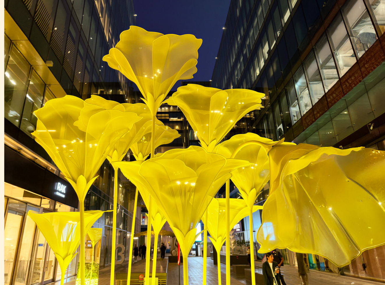
Dubai Design District, UAE