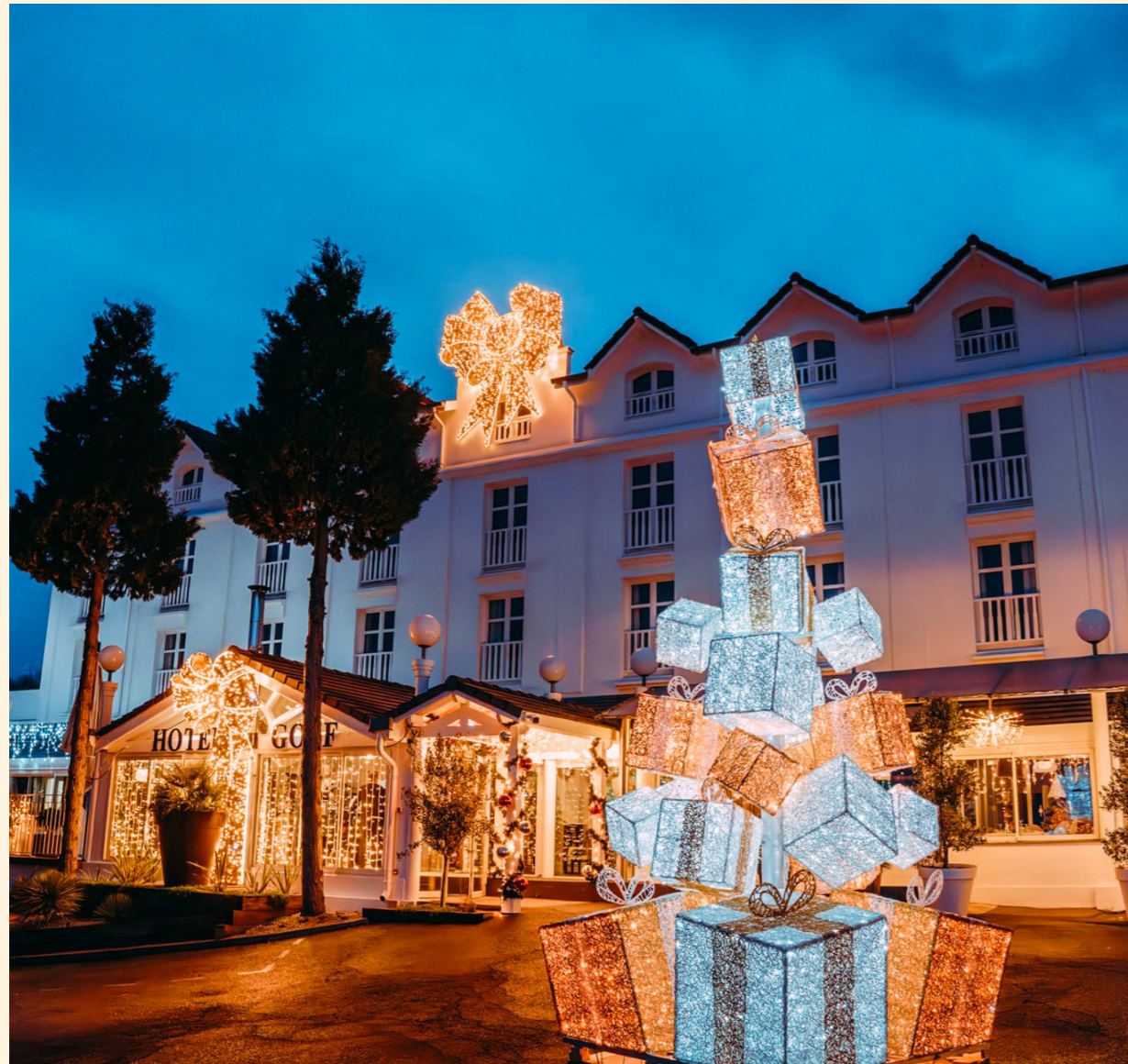
Hôtel du Golf, Saint-Etienne, France