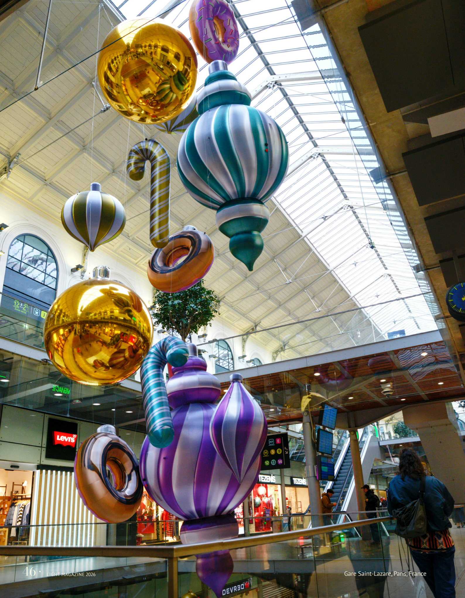
Gare Saint-Lazare, Paris, France