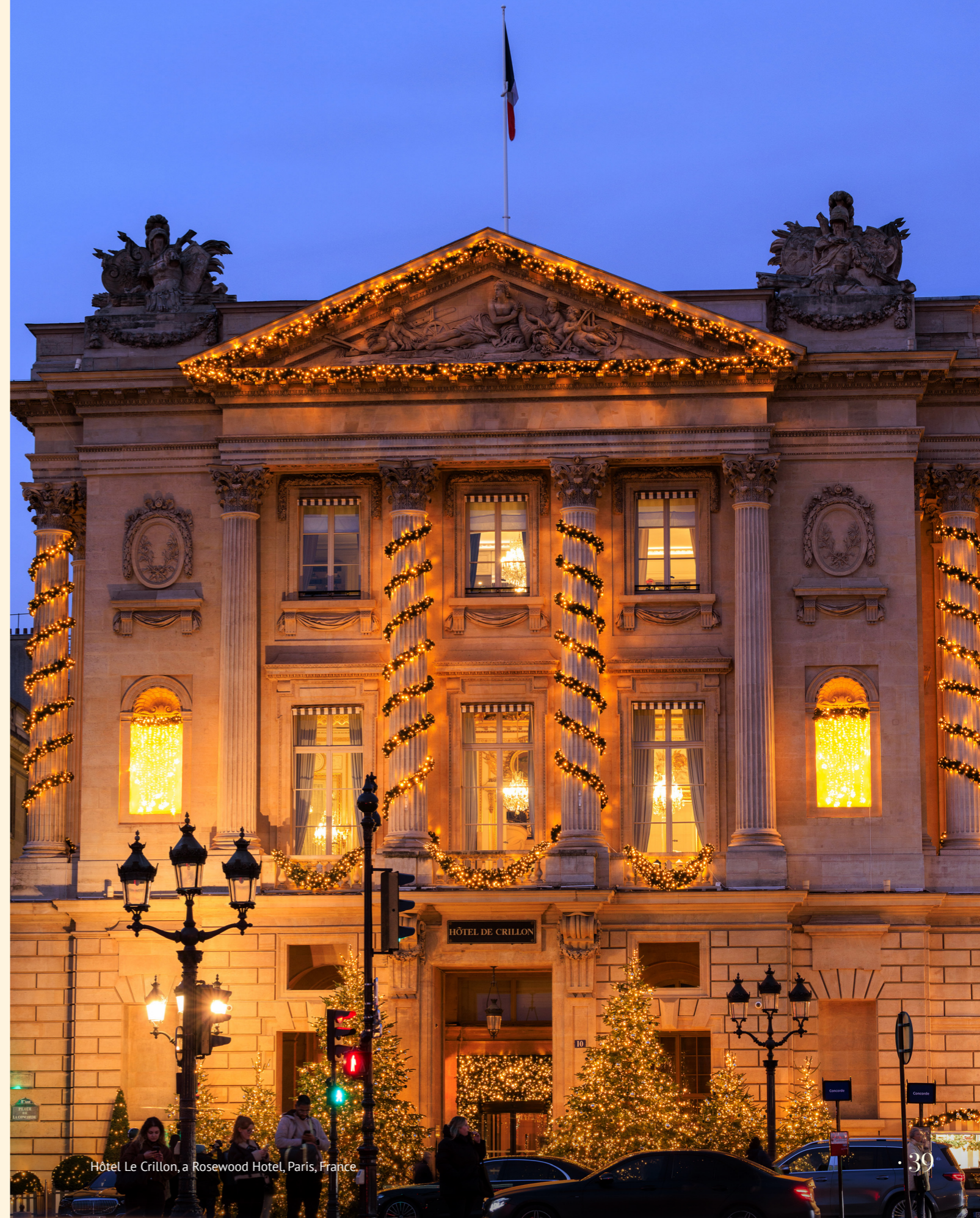
Hôtel Le Crillon, a Rosewood Hotel, Paris, France