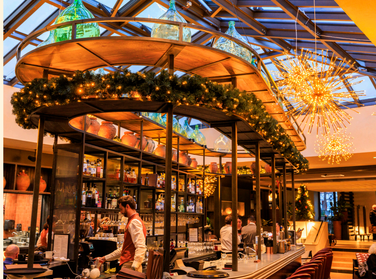
Hôtel L'Isle de Leos, L'isle-sur-la-Sorgue, France