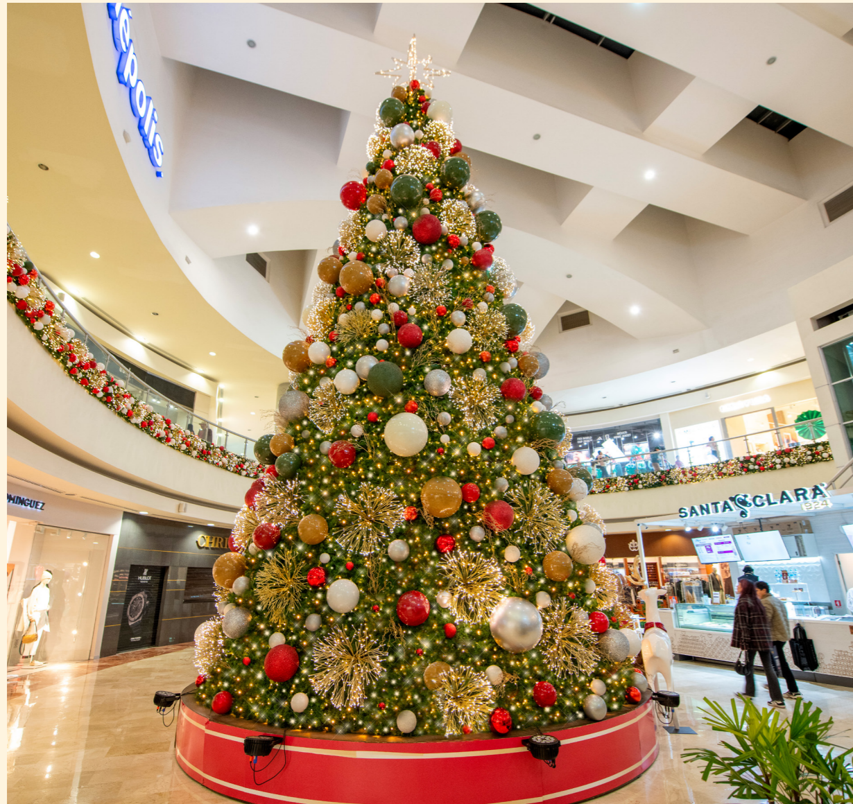
Centro comercial Altaria, Aguascalientes, Mexico