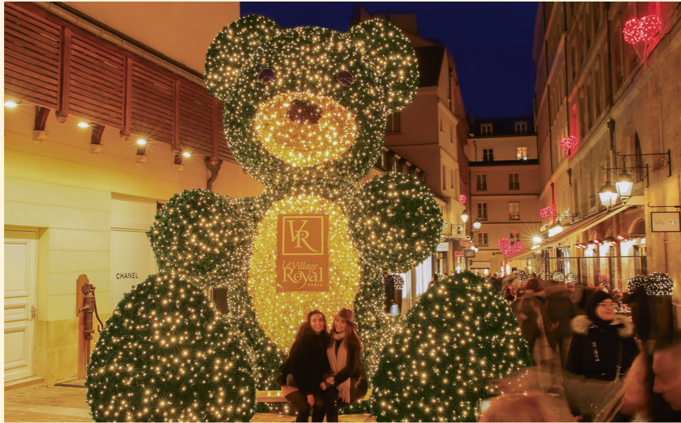
Village Royal, Paris, France