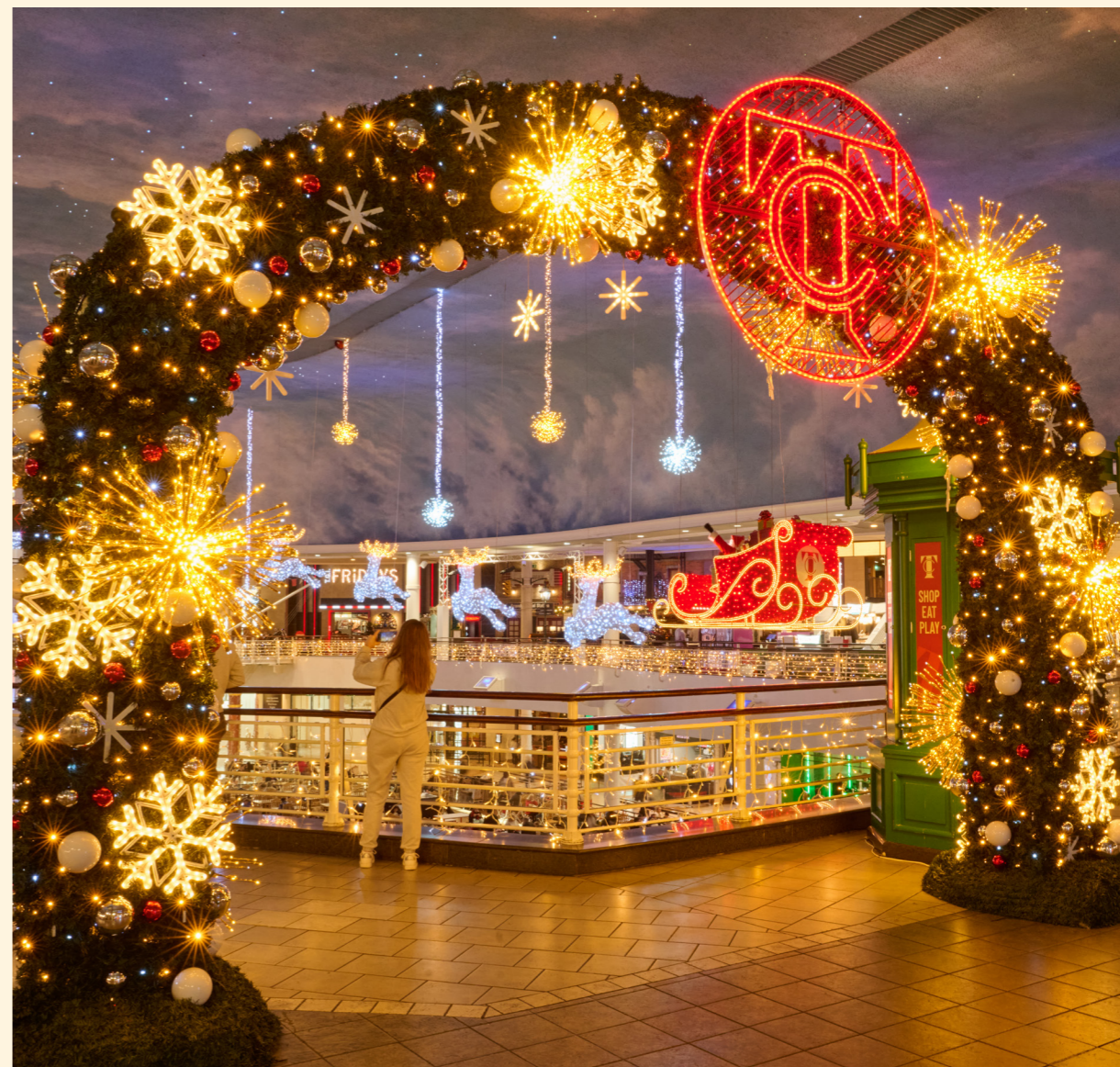
Trafford Centre, Manchester, UK