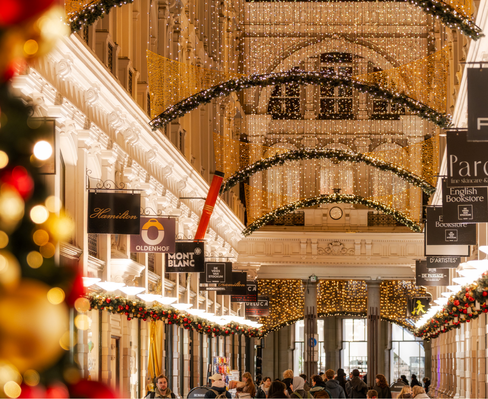
De Passage, Den Haag, The Netherlands