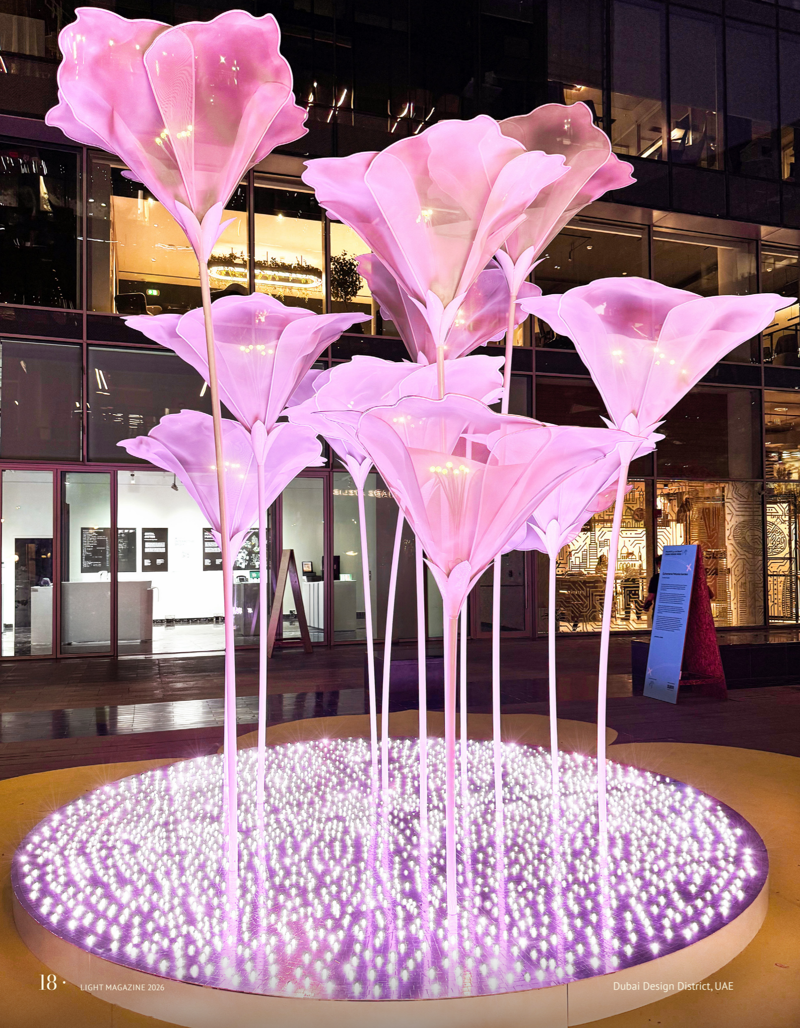
Dubai Design District, UAE