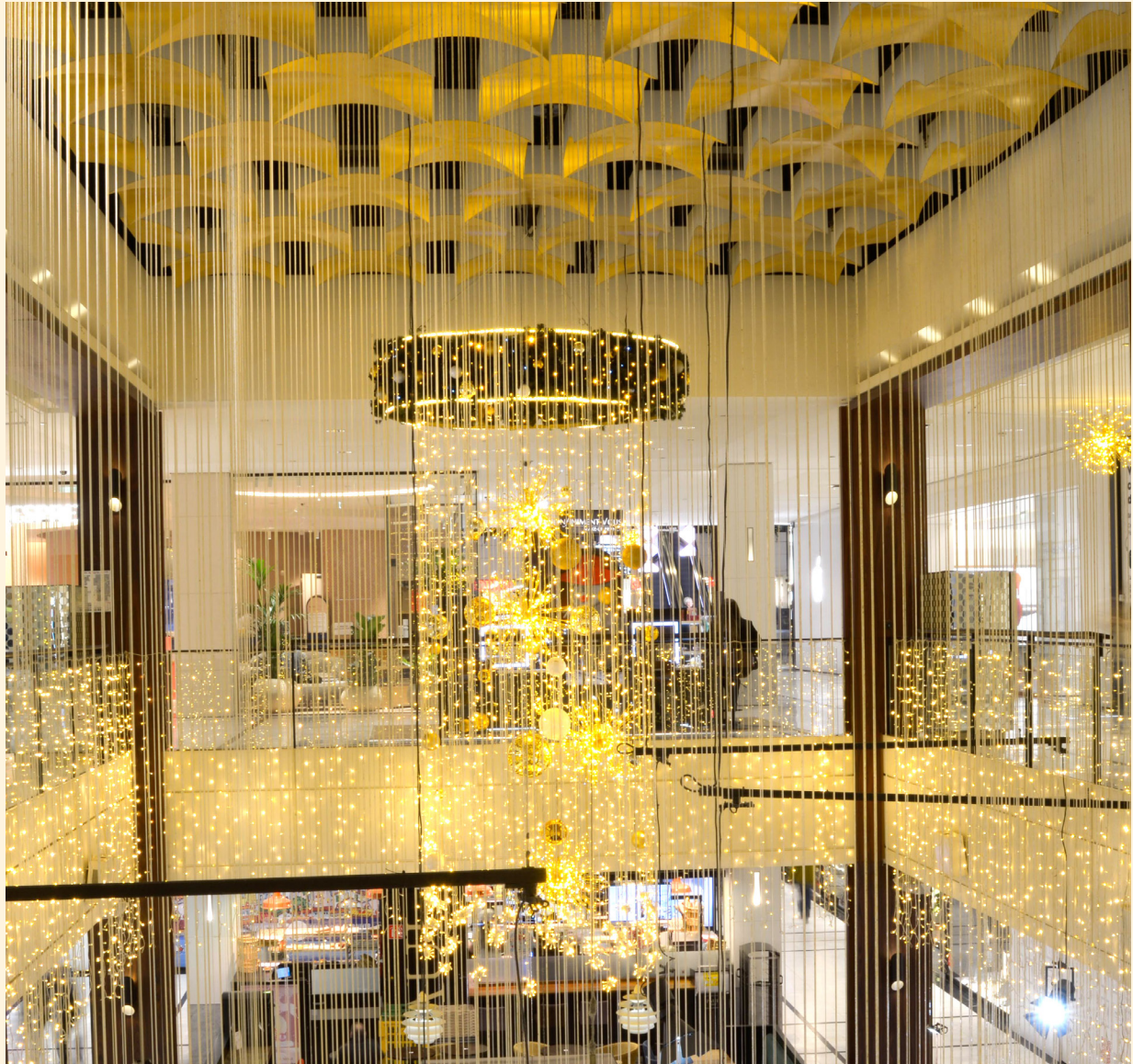
Westfield Parly 2, France