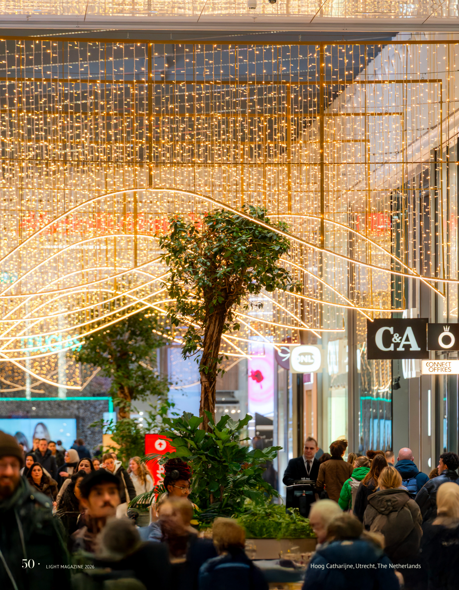
Hoog Catharijne, Utrecht, The Netherlands