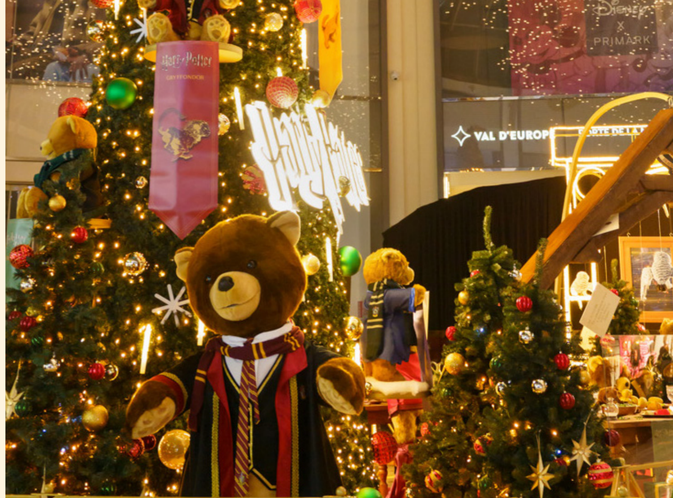
Klépierre Val d'Europe, France