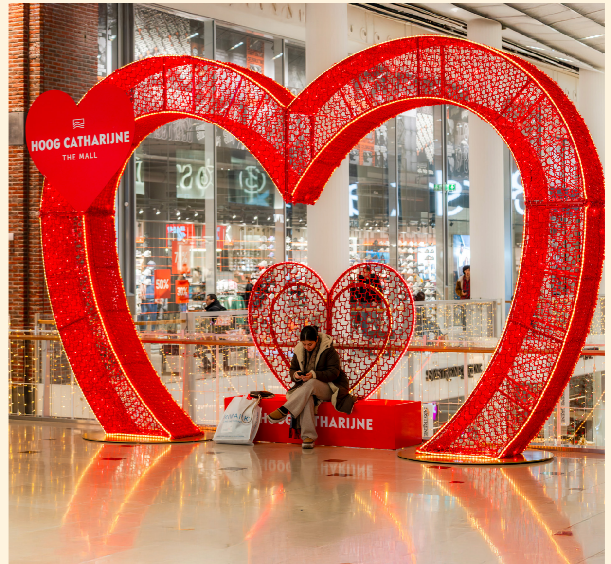
Hoog Catharijne, Utrecht, The Netherlands