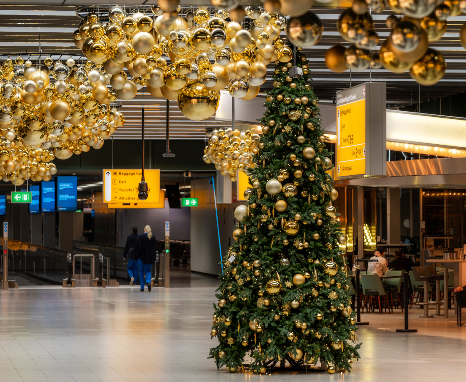
Schiphol Amsterdam Airport, The Netherlands