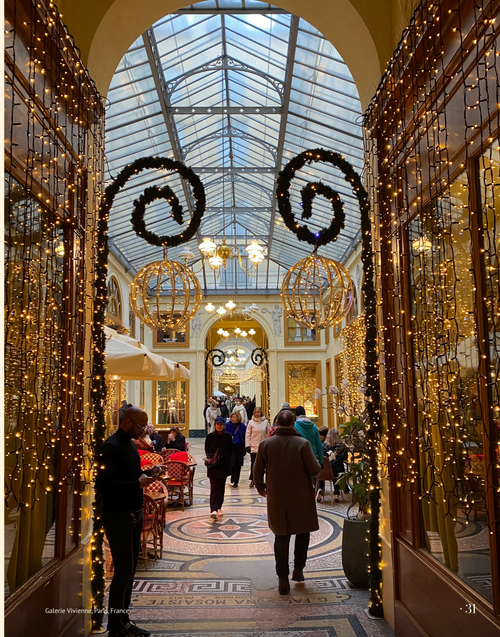
Galerie Vivienne, Paris, France