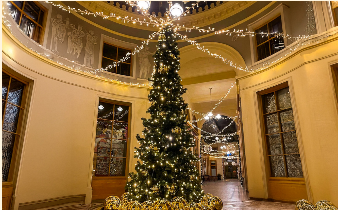
Galerie Vivienne, Paris, France