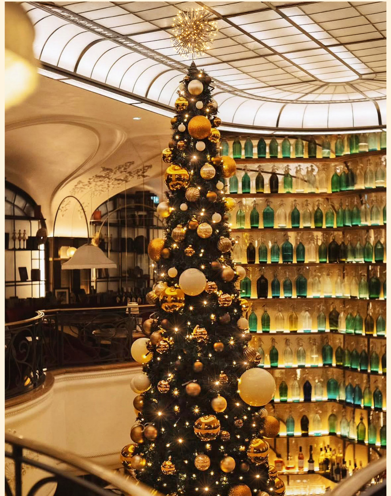
Restaurant Rose du Pont, Chamonix, France

During the Christmas season, cozy alpine chalets and restaurants come alive, bathed in the glow of festive lights.