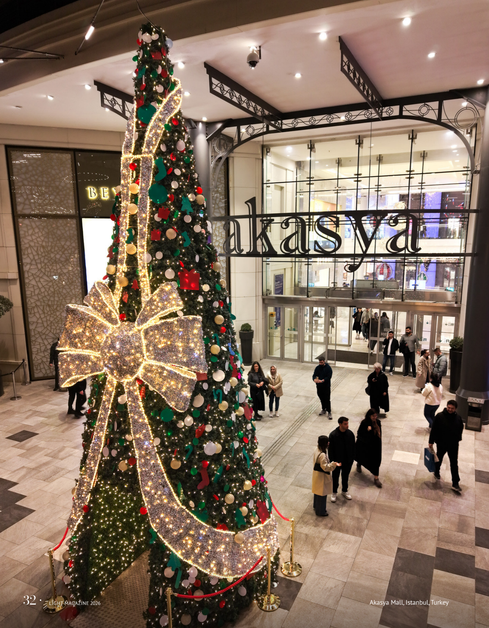
Akasya Mall, Istanbul, Turkey