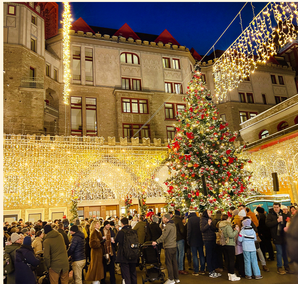
Badrutt's Palace, St Moritz, Switzerland