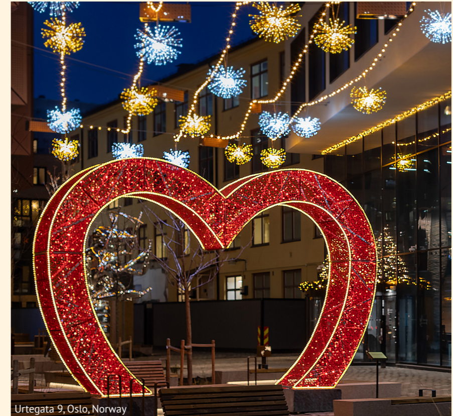
Urtegata 9, Oslo, Norway

Our history It all started in 1973, in Apt in the heart of Provence. When Jean Paul Blachère illuminated his first village, the smiles and faces of the inhabitants made him realise the unique magical power of light.