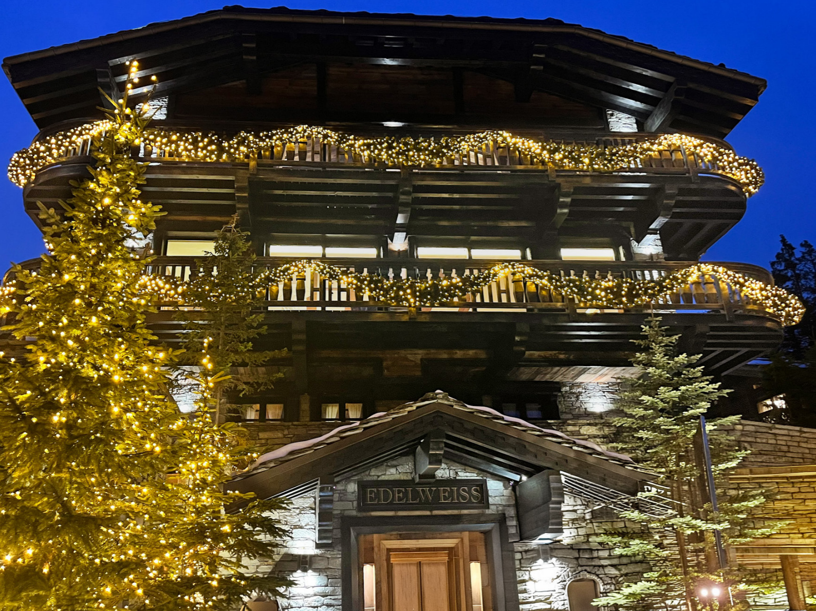
Chalet «L'Edelweiss», Courchevel 1850, France